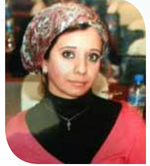
سهى الخزرجي محامية وناشطة حقوقية

من حقوق الخدم: المعاملة الإنسانية، أداء الحقوق والراتب، وإطعامه والإنفاق عليه، وعدم تحميله ما لا يطيق