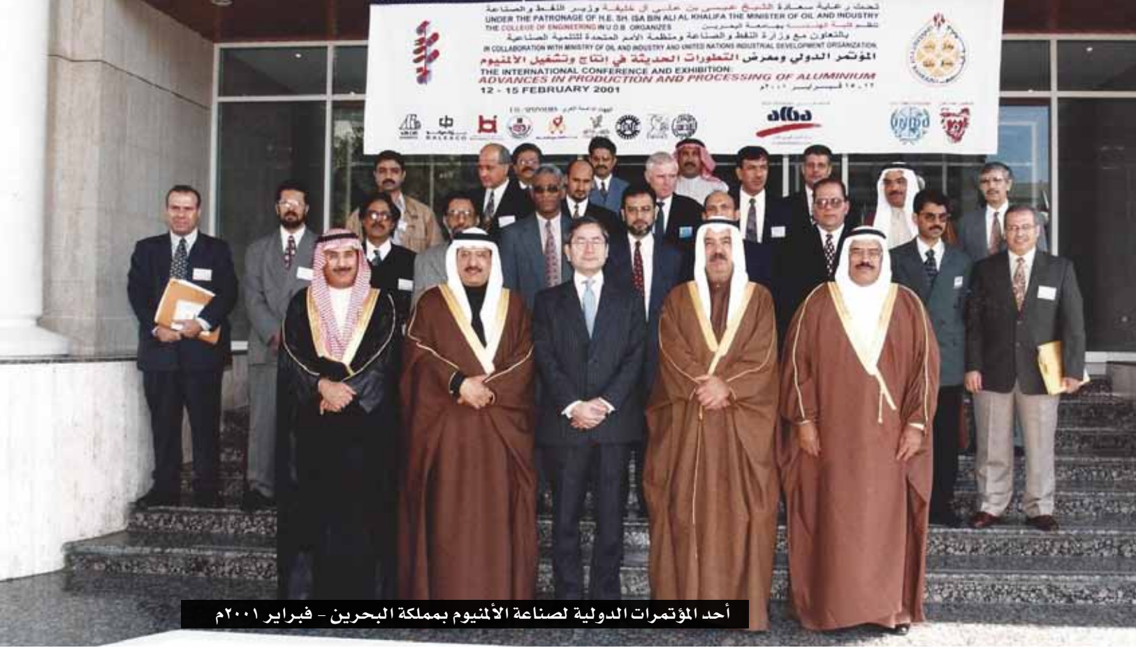
أحد المؤتمرات الدولية لصناعة الألمنيوم بمملكة البحرين - فبراير ٢٠٠١م