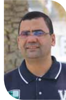
حمدي عبد العزيز

لقد بقيت أعوام قليلة بعمر الشعوب على تطبيق هذه الرؤية، مع أهمية مراجعتها، من زوايا: مشاركة القطاع الخاص في التصنيع بالتعاون مع القطاع الحكومي، الانتقال من المشروعات الاجتماعية الصغيرة التي تستند إلى التجربة البنغالية إلى مشاركة هذه المشروعات في تجربة التصنيع بالإستناد إلى التجارب التركية والهندية والبرازيلية. أعز الله البحرين ووفق قيادتها.