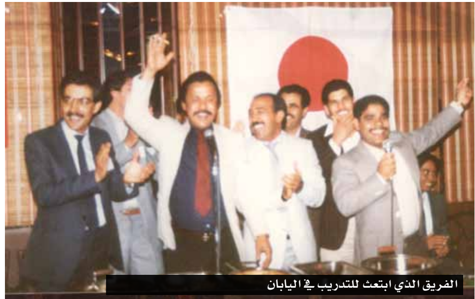
الضيق الذي ابتعث للتدريب في اليابان