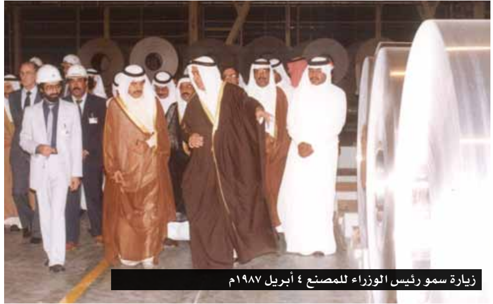
زيارة سمو رئيس الوزراء للمصنع ٤ أبريل ١٩٨٧م

ذلك من أحسن التجارب في حياتي، حيث اكتسبت الكثير من الخبرة العملية والفنية والإجتماعية. كذلك كنا خير سفراء لبلدنا البحرين. وبالإضافة لساعات العمل الطويلة؛ كانت هناك أوقات مرح وطرب. وكان نجم الطرب عبد الرحيم هزيم «بوشوقي»، ولولاه ما صبرنا تلك المدة. ويتابع بوعلاي: افتتحت