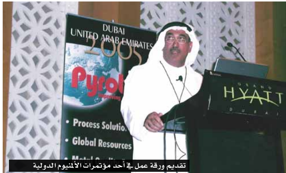
تقديم ورقة عمل في أحد مؤتمرات الألومنيوم الدولية