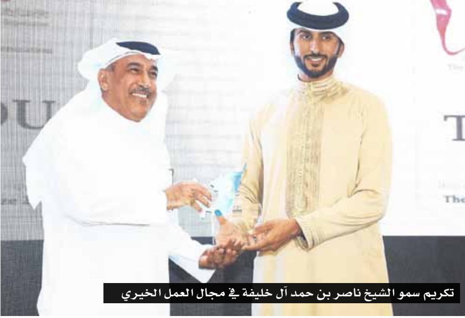
تكريم سمو الشيخ ناصر بن حمد آل خليفة في مجال العمل الخيري

وتم اختياري ضمن ١٢ إداري من ١٢ شركة صناعية وخدمائية في مملكة البحرين. وكان البرنامج يدار من قبل المجلس الأيرلندي للتطوير. نقلت إلى الوزارة لمدة سنتين من ١٩٨٩م إلى ١٩٩٠م.