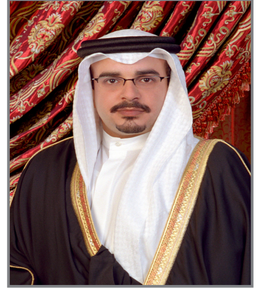
حضرة صاحب السمو الملكي الأمير