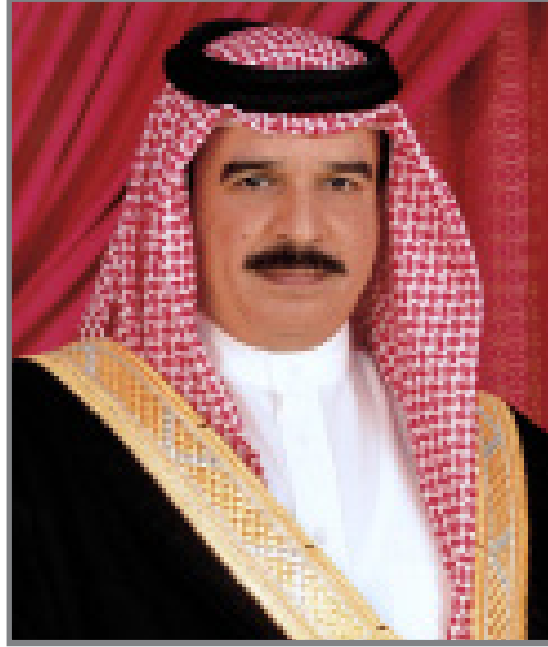
حضرة صاحب الجلالة