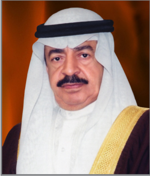
حضرة صاحب السمو الملكي الأمير